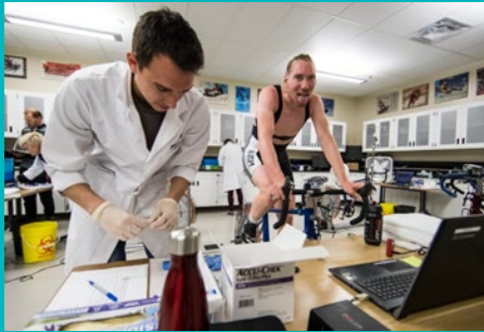
impact sur l'athlète Ted Bloemen